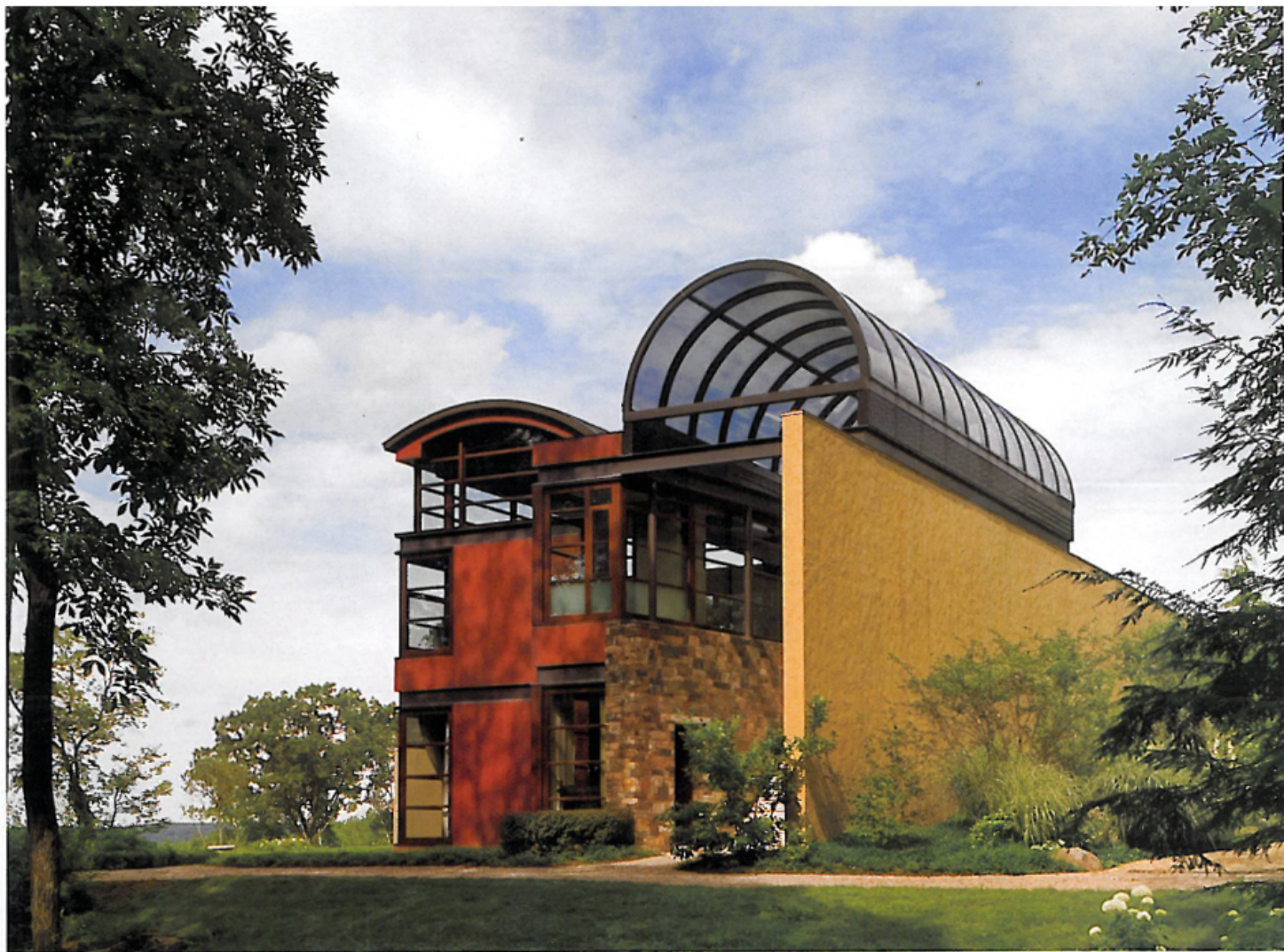
ARRIBA: La vista occidental de la casa para huéspedes, donde la pared de estuco pintada de carmesí contrasta con las grandes ventanas enmarcadas con caoba y donde culmina la pared de la terraza estilo toscano. IZQUIERDA: Frente a la ondulada pared de piedra de Pennsylvania en el área inferior de la casa para huéspedes, y de una serie de terrazas para relajarse y comer, se encuentra un césped y una piscina.