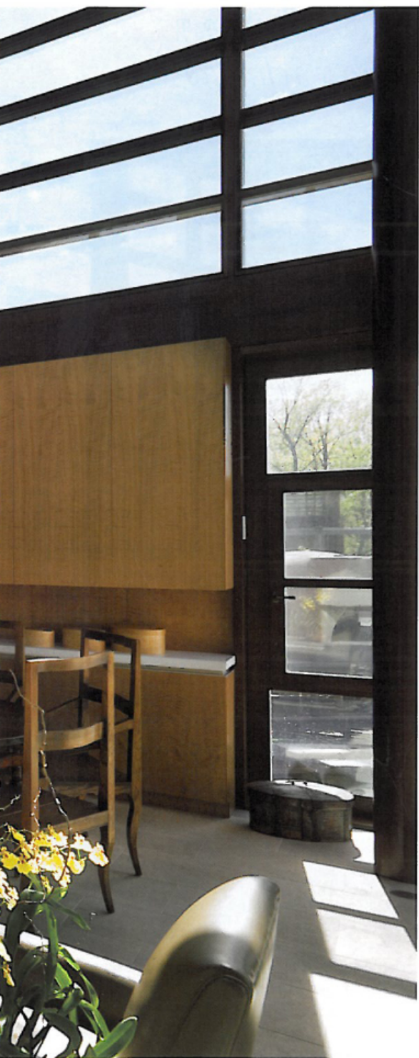
ARRIBA: La sala de estar colinda con la cocina. La mesa baja de cerezo es del siglo XIX, de Suzanne Golden. El Ushak del siglo XIX de Doris Leslie Blau y la mesa de comedor con pedestal son de Tucker Robbins. Para el diseño revestido con titanio de la cocina se consultó al chef Jean Georges Vongerichten. ARRIBA DERECHA: El comedor tiene vista a un patio con estanque y piso de piedra caliza. DERECHA: El plano muestra la ubicación de la casa principal en relación a la casa para huéspedes, así como la terraza cerrada que unifica arquitectónicamente las dos estructuras en la propiedad de 5.6 hectáreas.